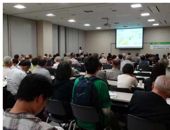
100人以上の参加者で埋まった会場