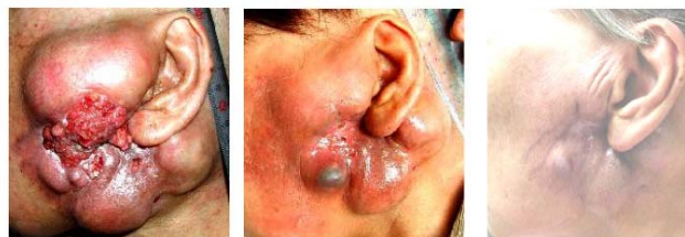
治療前 1回治療後 2回治療後