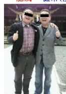
一卵性双生児 肥満 健康(痩身)