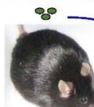
肥満マウス 満腹中枢の壊れたマウス