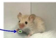
満腹中枢の壊れていない 健康な無菌マウス