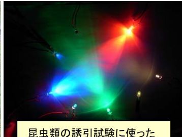
昆虫類の誘引試験に使ったLEDから発する様々な光