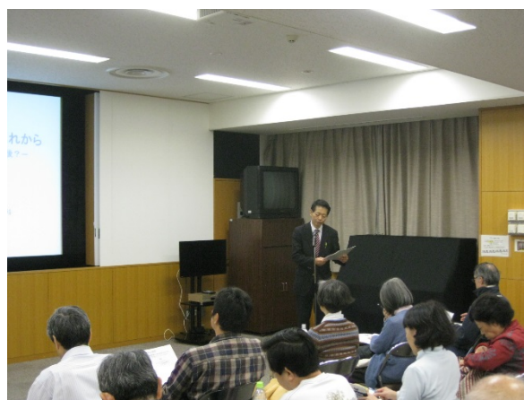
村上社会連携本部長の挨拶