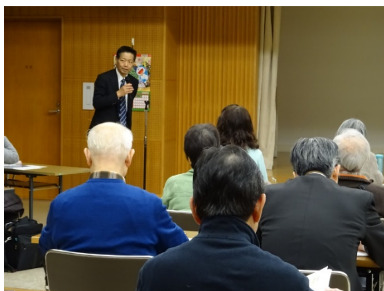
村上社会連携本部長の挨拶